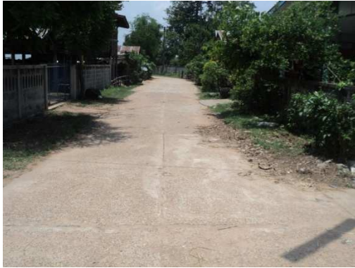
0+000 จุดเริ่มต้นโครงการ