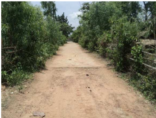
3+500 จุดสิ้นสุดโครงการ