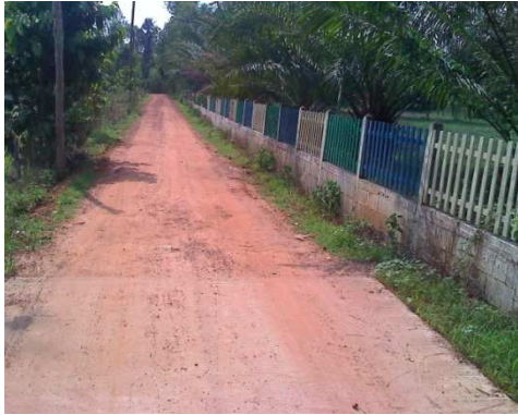
0+000 จุดเริ่มต้นโครงการ