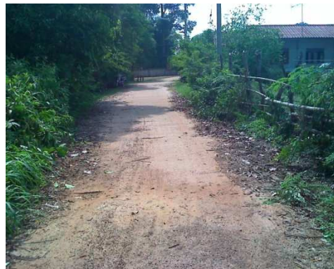
2+200 จุดสิ้นสุดโครงการ