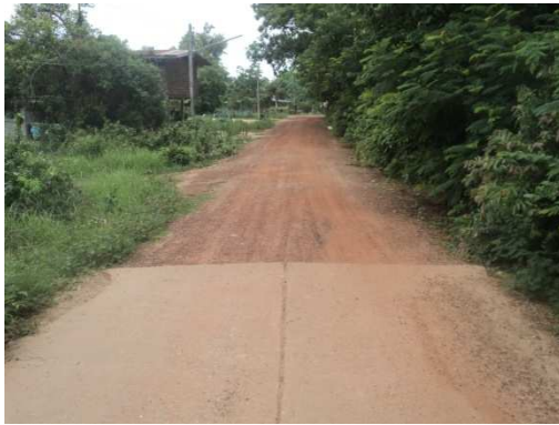
0+000 จุดเริ่มต้นโครงการ