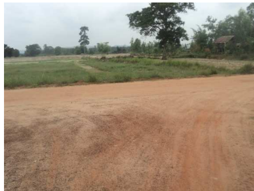
5+400 จุดสิ้นสุดโครงการ