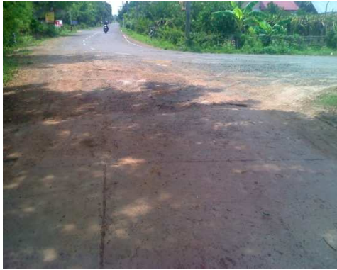
0+000 จุดเริ่มต้นโครงการ