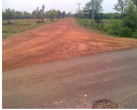
3+000 จุดสิ้นสุดโครงการ