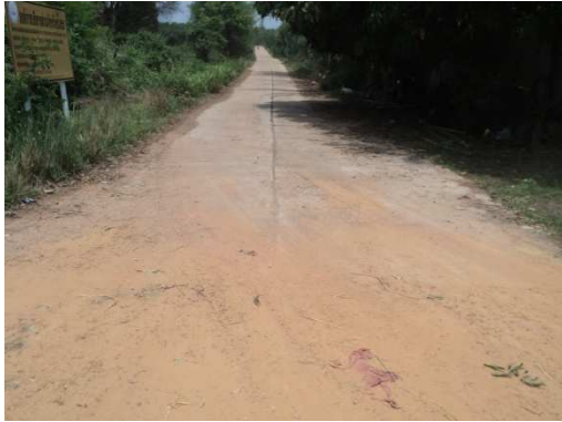
0+000 จุดเริ่มต้นโครงการ ช่วงที่ 1