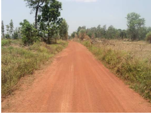
0+000 จุดเริ่มต้นโครงการ ชาวงที่2