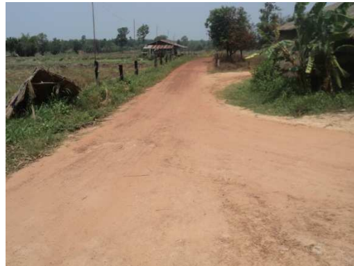
4+100 จุดสิ้นสุดโครงการ ช่วงที่1