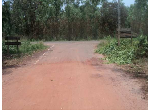
3+700 จุดสิ้นสุดโครงการ