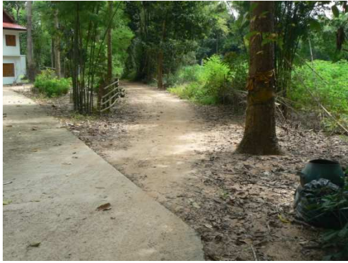
๐+๐๐๐ จุดเริ่มต้นโครงการ