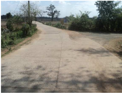
0+000 จุดเริ่มต้นโครงการ