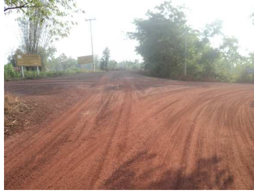
3+600 จุดสิ้นสุดโครงการ