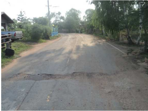
0+000 จุดเริ่มต้นโครงการ