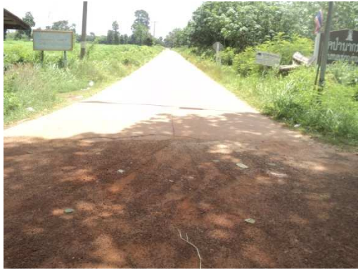
0+000 จุดสิ้นสุดโครงการ