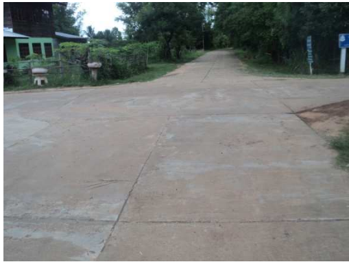
6+100 จุดสิ้นสุดโครงการ