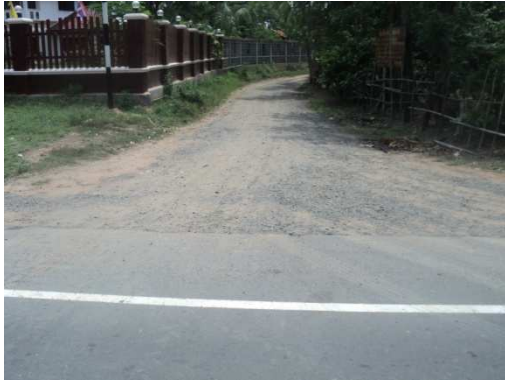
0+000 จุดเริ่มต้นโครงการ