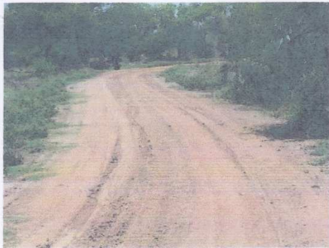
1 + 500