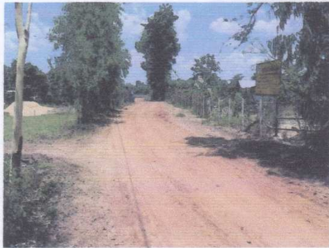
จุดเริ่มต้นโครงการ 0 + 000