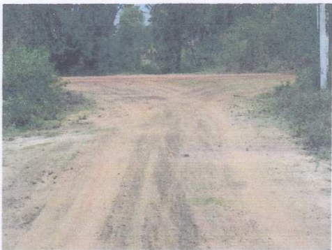
จุดสิ้นสุดโครงการ 2 + 700