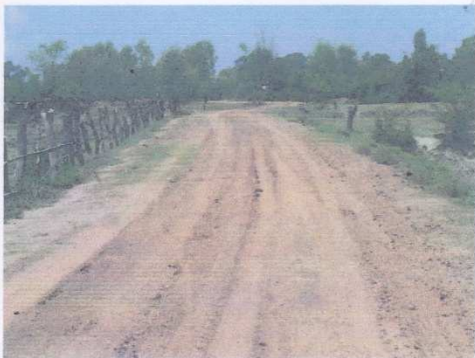
1 + 000