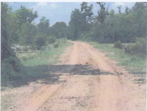
2 + 000