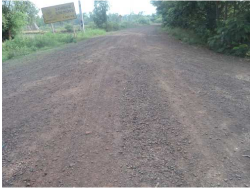
0+000 จุดเริ่มต้นโครงการ