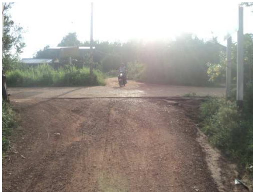
9+800 จุดสิ้นสุดโครงการ