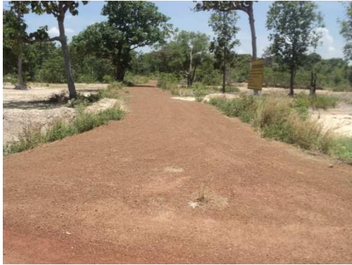
0+000 จุดเริ่มต้นโครงการ