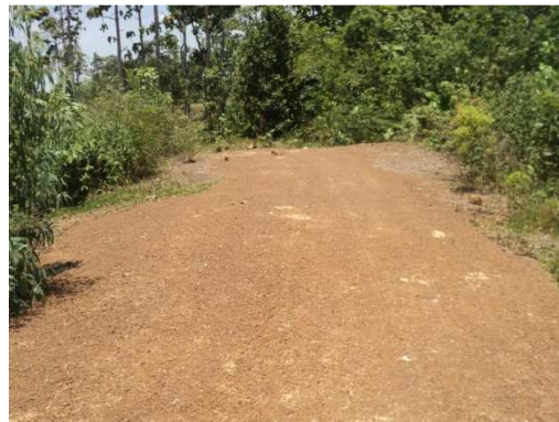
1+500 จุดสิ้นสุดโครงการ