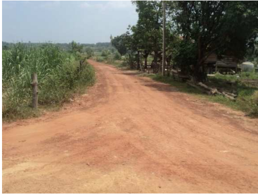
0+000 จุดเริ่มต้นโครงการ