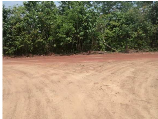
2+200 จุดสิ้นสุดโครงการ