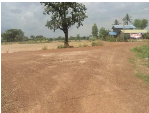
4+500 จุดสิ้นสุดโครงการ