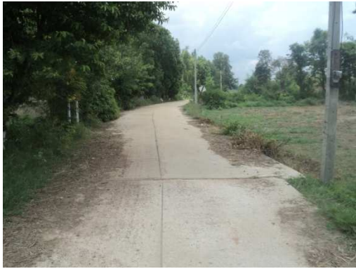
0+000 จุดเริ่มต้นโครงการ