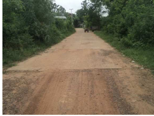
3+400 จุดสิ้นสุดโครงการ