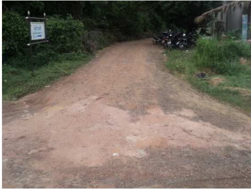
0+000 จุดเริ่มต้นโครงการ