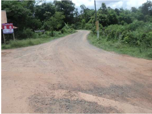
0+000 จุดเริ่มต้นโครงการ