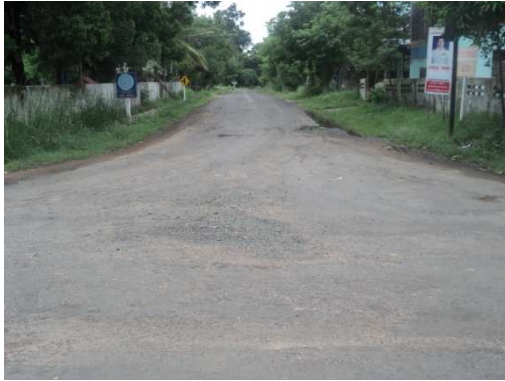
0+000 จุดเริ่มต้นโครงการ