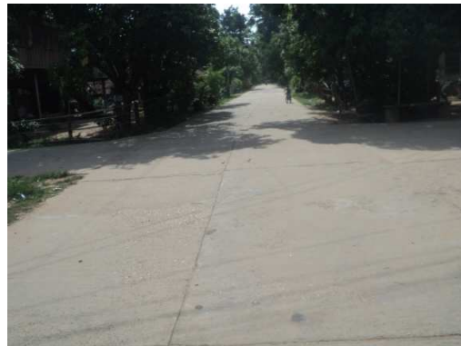
2+100 จุดสิ้นสุดโครงการ