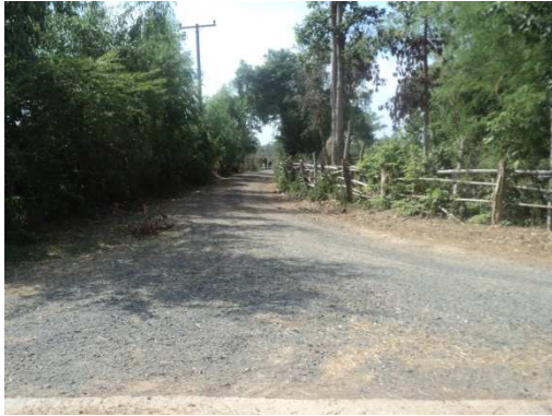
0+000 จุดเริ่มต้นโครงการ